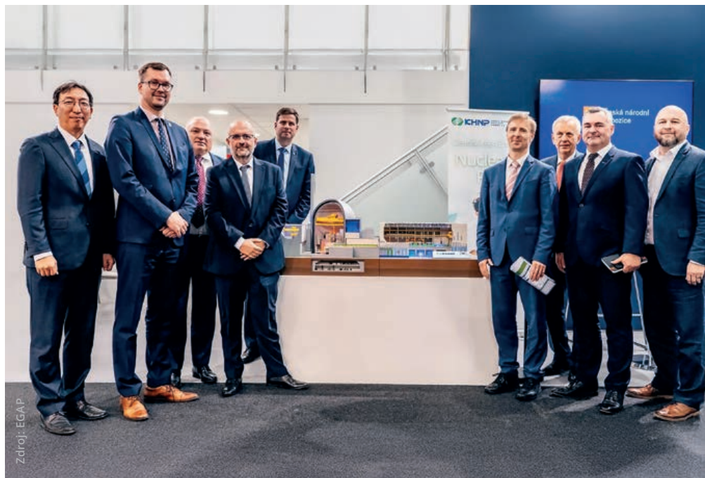
Zástupci státu spolu s hlavním dodavatelem, jihokorejskou KHNP, se shodují, že podíl českých firem bude činit kolem 60 procent hodnoty projektu