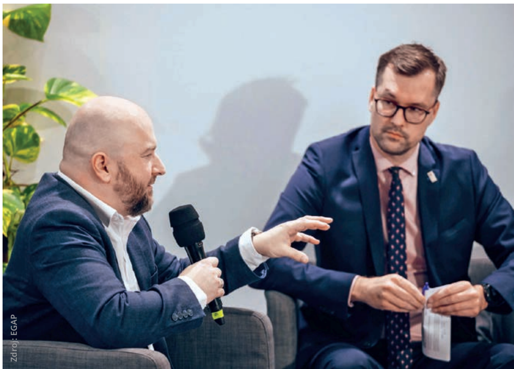
V debatě se vedle podílu českých firem na dodávkách pro Dukovany řešily také možnosti pojištění dodávek na Ukrajinu nebo v budoucnu pro malé modulární reaktory.

Krček ze Škody JS připomněl, že výhody podobného efektu už firma pocítila. Šlo o práce pro francouzskou společnost Framatome . „Před 15 lety nás oslovili, abychom dodali části pro čínskou jadernou elektrárnu.“