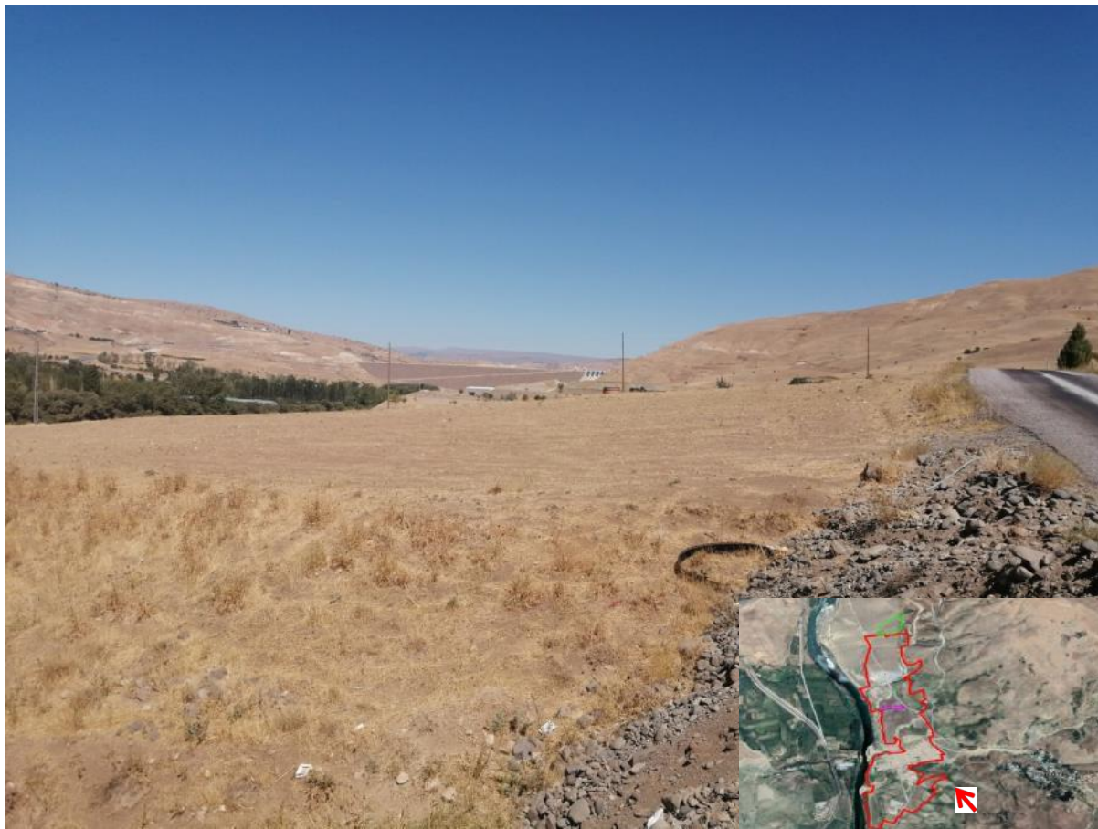
Obr. 2 Detail umístění A